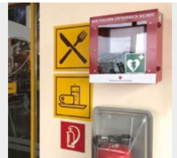
Bergbahnen Sölden / Maier

Laiendefi genannt) im Skigebiet gesucht und diese in der bahneigenen Gastronomie gefunden. Damit potenzielle Ersthelfer nicht lange suchen müssen, sind die Defis in auffallenden feuerroten Schutzkästen mit Sichtfenster bei den Hauptzugängen der Restaurants Giggijoch, Schwarzkogl, Almstube, Ice-Q, Retten- und Tiefenbachgletscher montiert. Dadurch sehen die Gäste diese bereits beim Eintritt in die Restaurants und merken sich eher deren Standorte. Maier ergänzt: „Im Gegensatz zu Defibrillatoren aus dem Rettungsdienst oder Kliniken sind AEDs wegen ihrer Bau- und Funktionsweise besonders für Laienhelfer geeignet. Der Anwender wird sowohl mit angezeigten als auch mit gesprochenen Anweisungen durch die Reanimation geführt. Und die Führungskräfte in der Gastronomie erhalten regelmäßig entsprechende Schulungen von den Ausbildnern unter unseren Pistenrettern.“